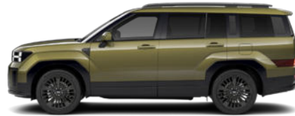
Ocado Green Pearl