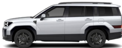
Typhoon Silver Metallic