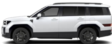
Creamy White Matte