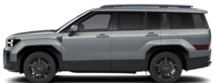
Pebble Blue Pearl