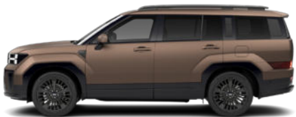
Earthy Brass Matte