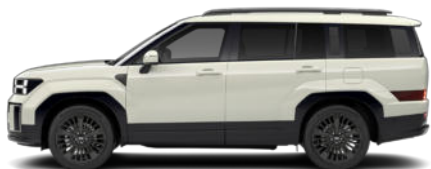
Cyber Sage Pearl