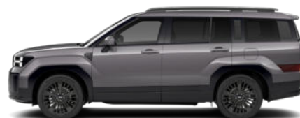
Magnetic Gray Metallic