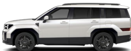
Creamy White Pearl