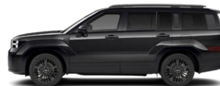
Abyss Black Pearl